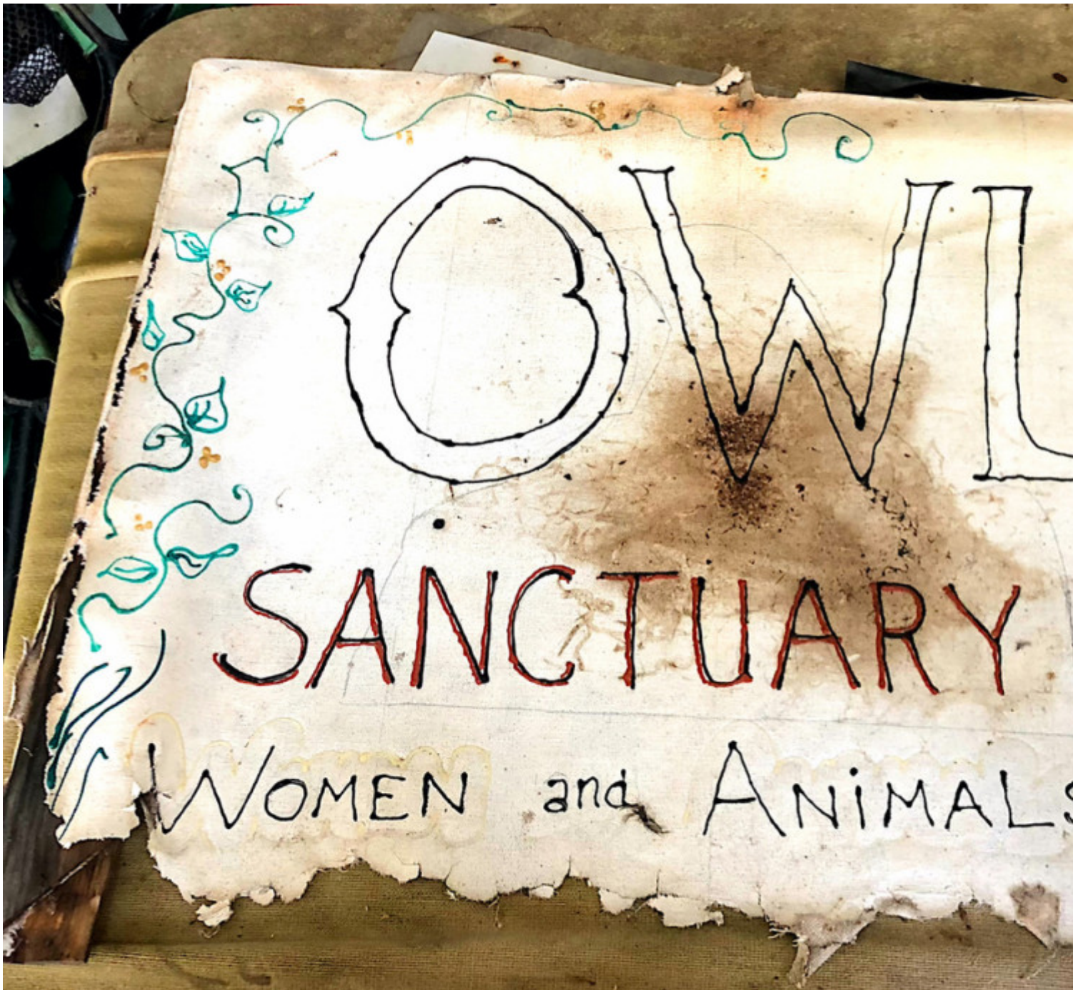
Original sign from OWL Farm, c. 1976. [Sasha Archibald]