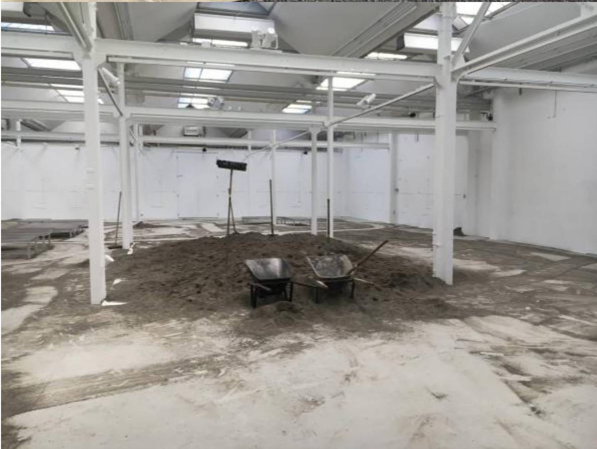
Ausstellungsprojekt 13 m 3 Sand - Ihr bringt die Schaufeln, wir haben den Sand , Shedhalle Zürich, 2019

Bei der Shedhalle verhedderte sich die Institution in den letzten Jahren in einer Beschäftigung mit sich selbst: Anhaltende Spannungen und Wechsel in der kuratorischen Leitung, eine