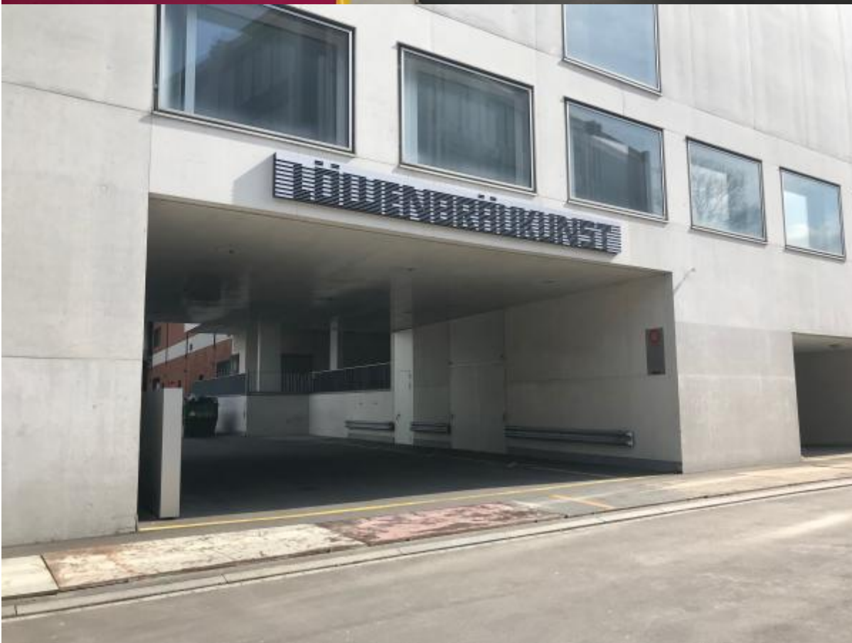
Umbauarbeiten im Löwenbräukunst Zürich, April 2019

Von der damaligen Vitalität ist heute nichts mehr zu spüren. Die Shedhalle, aktuell interimistisch geleitet, lädt jeweils am letzten Donnerstag im Monat zum Leichenmahl ein. Bei diesen (semi-)öffentlichen Treffen diskutieren Gäste und weitere Interessierte über