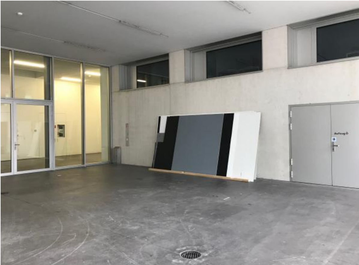
Umbauarbeiten im Löwenbräukunst Zürich, April 2019

In den 1990er Jahren kam es in Zürich zu einem sogenannten Kunstwunder: [1] [/b-n-l-de/dead-end/pdf#a2] Zahlreiche Galerien entstanden, die Kunsthalle kam dazu, das Migros-Kulturprozent lancierte ein eigenes Museum, und unzählige, selbstorganisierte Kunsträume prägten die Zürcher Kunstszene. Vor allem das 1996 gegründete Kunstkonglomerat auf dem Areal der ehemaligen Brauerei Löwenbräu und die, nach einer programmatischen Neuausrichtung, äusserst kontrovers aufgenommene Shedhalle erhielten internationale Aufmerksamkeit. Sie bildeten zwei Pole in der sich damals neu formierenden Zürcher Kunstszene: das Löwenbräu-Areal mit seiner Kunstmarkt-Nähe auf der einen und die Shedhalle mit ihrem politischen Programm auf der anderen Seite.